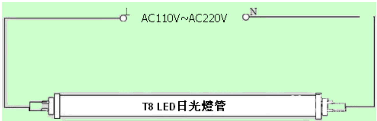
(圖一) 常规 LED 灯管接线